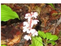
ベニバナイチヤクソウ