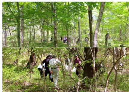
山菜採り、これ食える？