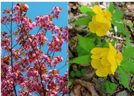
サトザクラ、ヤマブキソウ

ご馳走様でした。また、準備などお疲れ様でした。来年も楽しみにしています。参加者:20名