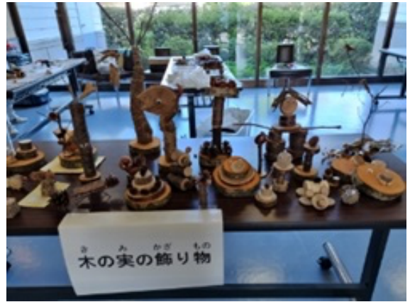
みんな楽しんで作りました!