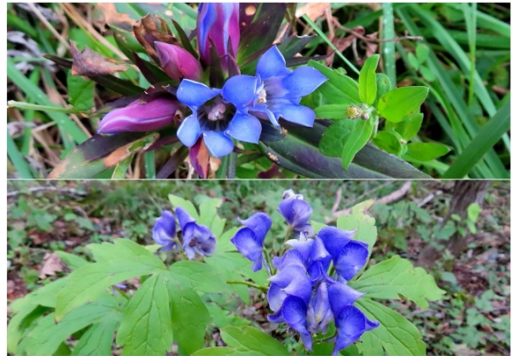
リンドウ、オクトリカブト