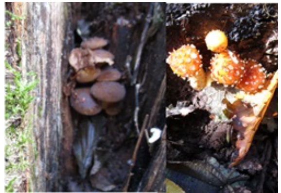
ムキタケ(左)、ヌメリスギタケ(右)

午後は、動物撮影班とキノコ採り班に分かれて活動。撮影できていないカメラがあり、担当者はがっかりしていましたが、キノコ採りのメンバーからハナイグチを沢山分けてもらって大喜びしました。(参加者:4名)